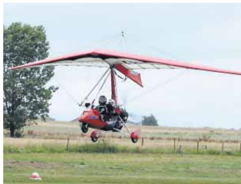
À côté du pilote, un ULM offre de la place pour un deuxième passager.

Ils ne pèsent pas plus de 500 kilos. Ils ne peuvent transporter que deux passagers, mais cela, pourquoi pas, jusqu'en Égypte : nous parlons des ultralégers motorisés. Samedi et hier, ces petites raretés de l'aviation étaient à l'honneur à Kitzebur. Les responsables de l'aérodrome local, les membres du club Aéroplume, spécialisé en ULM, avaient organisé leurs portes ouvertes annuelles. Le but était de familiariser le grand public avec cette façon de voler et de permettre aux plus curieux de survoler les environs lors d'un baptême de l'air. Par la même occasion, les pilotes expérimentés ont également présenté leur école de pilotage d'ULM, unique au pays. Là, en un an, tout un chacun peut apprendre à manier un ultraléger motorisé. Un défi à relever pour tous ceux qui depuis toujours rêvent de voler. Lire pages 8 et 9